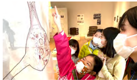
是恒さくらさんの作品は見れば見るほど、色々なものが見えてくる。

今日は2022年最初の活動日。新しく始まった企画展取材します！ 苦小牧を含む日胆(にったん)地域にゆかりのある美術家や建築家など4名のアーティストが集まり、「土地の記憶」をテーマに開かれています。 企画を考えたのは細矢久人学芸員。 土地の記憶ってなんだろう？ どんな作品になっているんだろう？