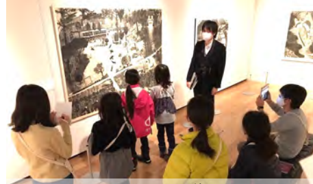
こだまみわこさんの作品はどこを見てもワクワクドキドキ。