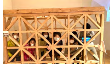
格子の間からみんなでピース！破壊実験すげー！