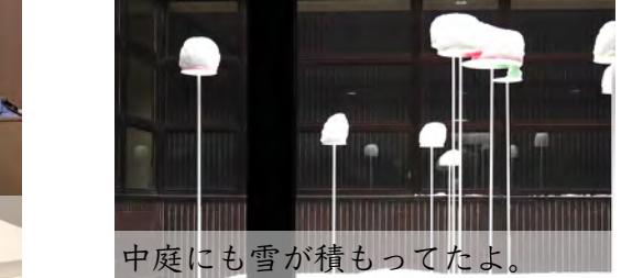
中庭にも雪が積もってたよ。